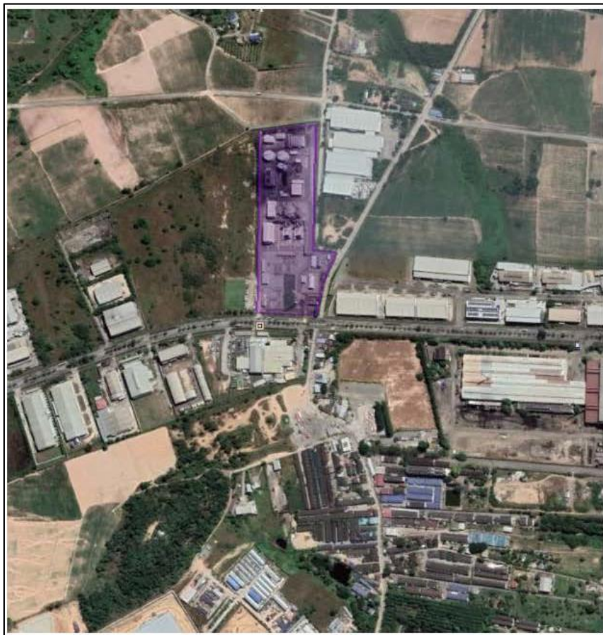
ภาพที่ 1.1 แผนที่แสดงตำแหน่งที่ตั้งโครงการ

ทิศตะวันตก ติดกับ ถนนภายในนิคมอุตสาหกรรมดับบลิวเอชเอ ชลบุรี 1